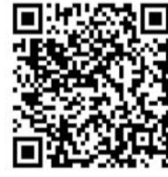
(鲁股市值50强榜单 详情请扫二维码)

其中，惠城环保是一家为炼油企业提供废催化剂处理处置的高新技术企业；绿能慧充是综合类企业，主营业务包括发电、铁路专用线运输两大类，公司发电业务是以上游钢铁、焦化企业的尾气为原料综合利用发电。很显然，作为传统能源产业链条上的这些高新技术企业，有效助力绿色低碳发展，颇受资本市场追捧。