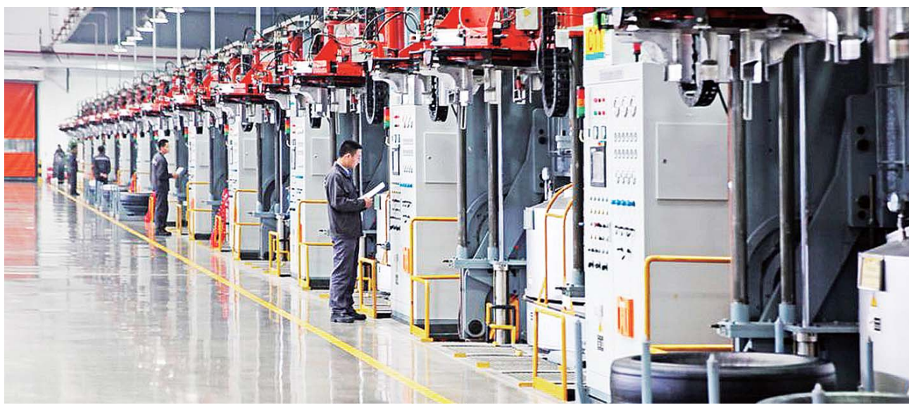
兖州大力实施创新驱动发展战略,区内企业新旧动能转换步伐明显加快。

兖州高新技术产值占规模以上工业产值的比重已达35.81%,科技创新正成为推动经济高质量发展主引擎