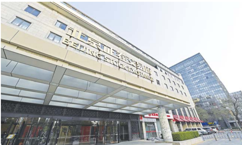
北交所对中小企业而言，起到的“促发展”作用非常明显。

新三板基础层和创新层将为北交所源源不断地输送上市资源，这会使得北交所充满活力，也会对投资者保持足够的吸引力