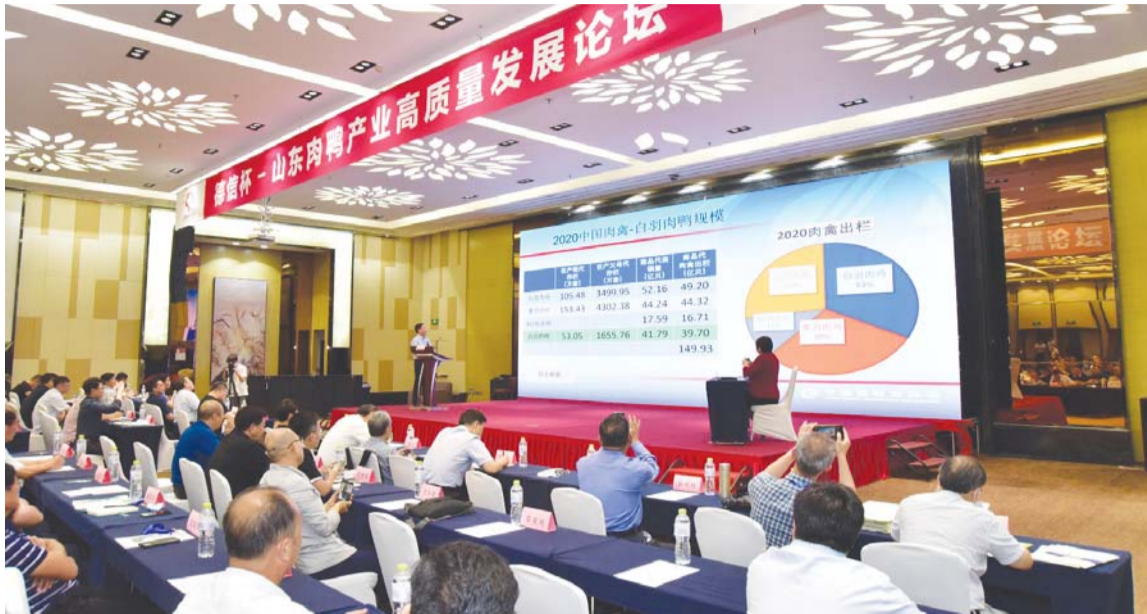
在日前召开的山东肉鸭产业高质量发展论坛上,与会专家和企业家共商发展大计。

面对肉鸭全产业产能非正常增长所暴露出来的问题,走高质量发展之路成为企业与专家的共同心声