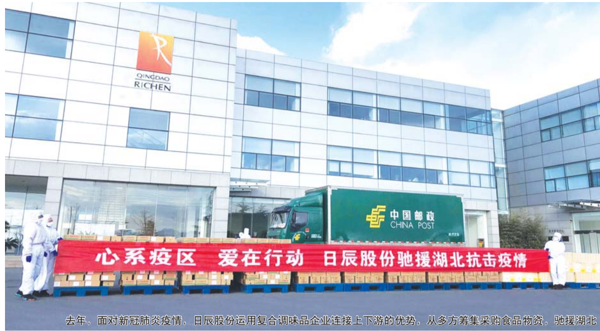
去年，面对新冠肺炎疫情，日辰股份运用复合调味品企业连接上下游的优势，从多方筹集采购食品物资，驰援湖北

对此，日辰股份表示，随着公司业务拓展和规模扩张，基于对公司未来发展的战略规划，为利用华东地区的区位优势，更好把握行业发展趋势，吸引高端研发人才，并对公司生产中心进行区域布局，经审慎研究，公司拟将首发募投项目中的“15000吨复合调味品生产基地建设”“年产5000吨汤类抽提生产线建设项目”的实施主体，由日辰股份变更为全资子公司日辰嘉兴，实施地点由日辰股份现有厂区变更为浙江