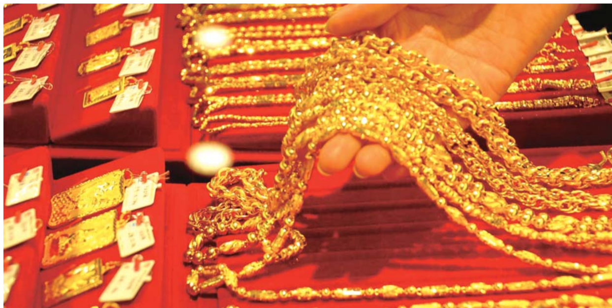
金价大幅上涨后调整风险加剧,投资需谨慎

比黄金销售更受关注的,还有黄金投资。31日,一位期货公司业务人员对经济导报记者表示,前来咨询黄金期货如何开户的人,多了不少,“现在不少交易APP都能线上开户,不过期货市场都是加杠杆操作,黄金期货起步资金就很大,一定是要有投资经验、抗风险能力强的投资者才能参与其中。”