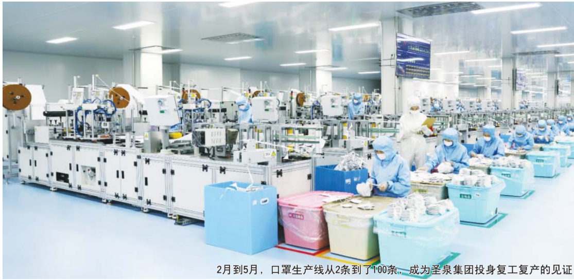
2月到5月,口罩生产线从2条到了100条,成为圣泉集团投身复工复产的见证

导报讯(记者 杜海)济南市章丘区卫生健康局日前发布的“章卫医罚【2020】5号”行政处罚决定书显示,济南蓝石医疗美容有限公司未取得《医疗机构执业许可证》,擅自开展诊疗活动。依据《医疗机构管理条例》第四十四条及《医疗机构管理条例实施细则》第七十七条,济南市章丘区卫生健康局对其进行了处罚:没收相关药品、器械,没收其违法所得1000元,罚款2000元。